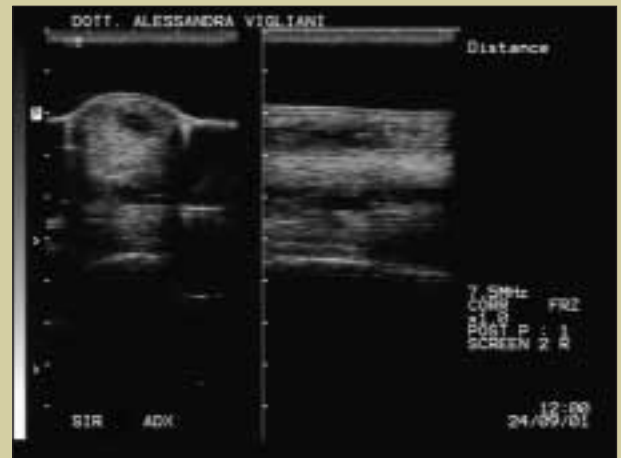
Caso controllo n. 2 T 15 .