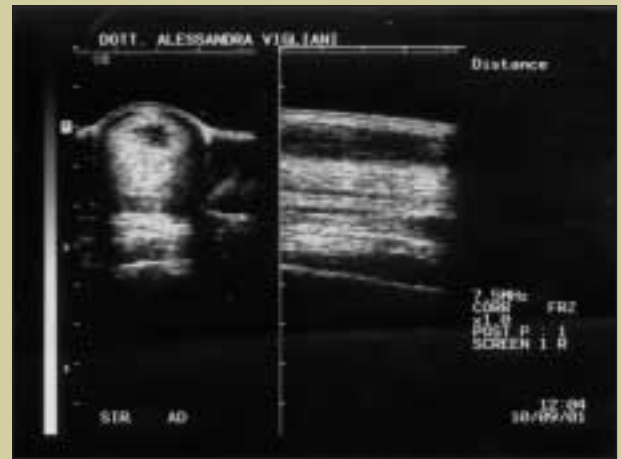
Caso controllo n. 2 T 0 .