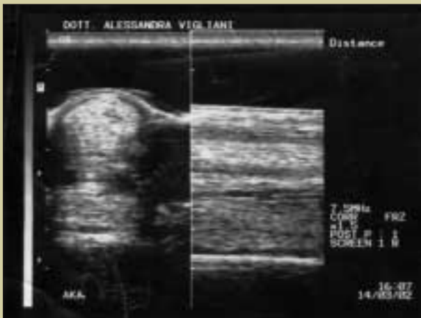
Caso trattato n. 1 T 15 .